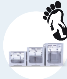
Impresora 3D Gran Formato Tumaker Big Foot