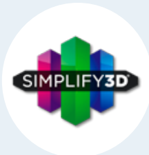
Gestión 3D profesional Simplify