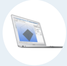
Uso avanzado de Repetier-Host y Slic3r