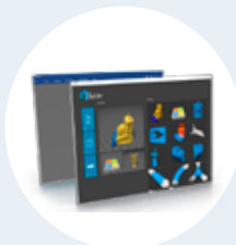
Softwares alternativos de impresión 3D