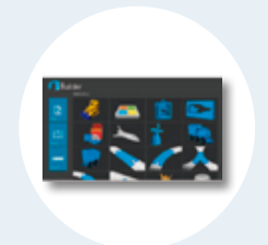
Software de diseño 3D Builder