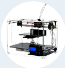
Impresora 3D parte I y II

Acceso ilimitado a una gama de cursos de formación específicos para el sector profesional.*