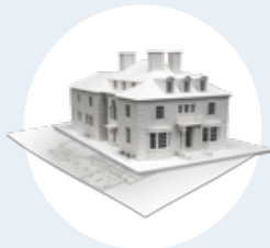
Impresora 3D parte III y IV