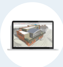
Software diseño 3D: Sketch Up