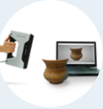
Digitalización inversa con escáner 3D